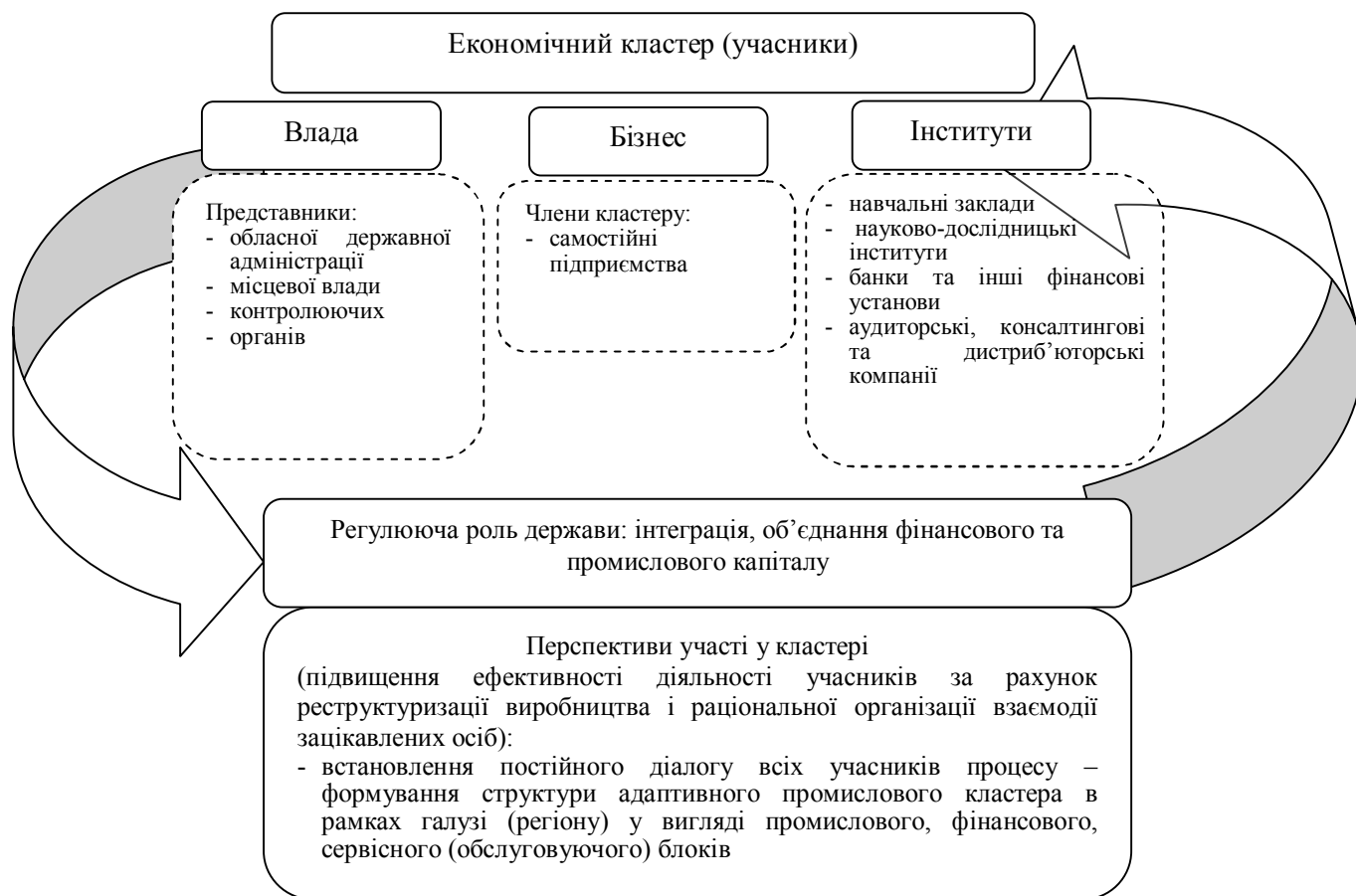
Рис. 4. Загальна схема регіонального промислового кластеру [3; 9]

Отже, найважливішим елементом кластерного принципу розвитку регіону є встановлення постійного діалогу всіх учасників процесу – малих і великих підприємств, владних структур, сервісних і науково-дослідницьких організацій, системи професійно-технічного утворення, ЗМІ тощо.