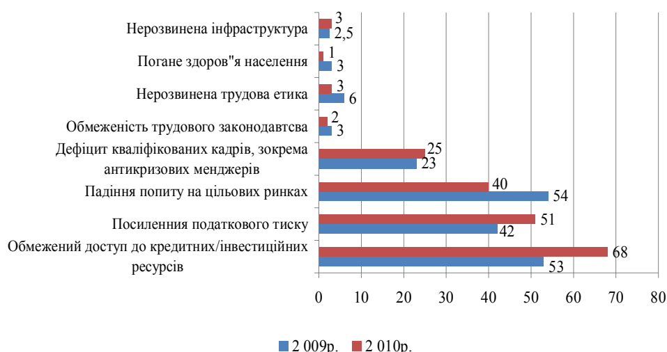
Рис. 2. Рейтинг факторів, що стримують розвиток бізнесу в Україні [8, с. 5]

В економіці України можливість кластеризації послаблюється низькою кваліфікацією робочої сили та незадоволеним рівнем її відтворення, нестачею доступного капіталу, слабкістю технологій, недостатньо розвиненою системою освіти і науки, недосконалими громадськими інститутами (рис. 2).