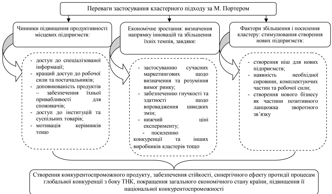
Рис. 1. Кластерна проблематика за М. Портером [7, с.36]

Об'єднання у кластер чи підприємницьку мережу здійснюється на основі симбіозної взаємозалежності між різними бізнес-суб'єктами за принципом синергізму (рис. 1).