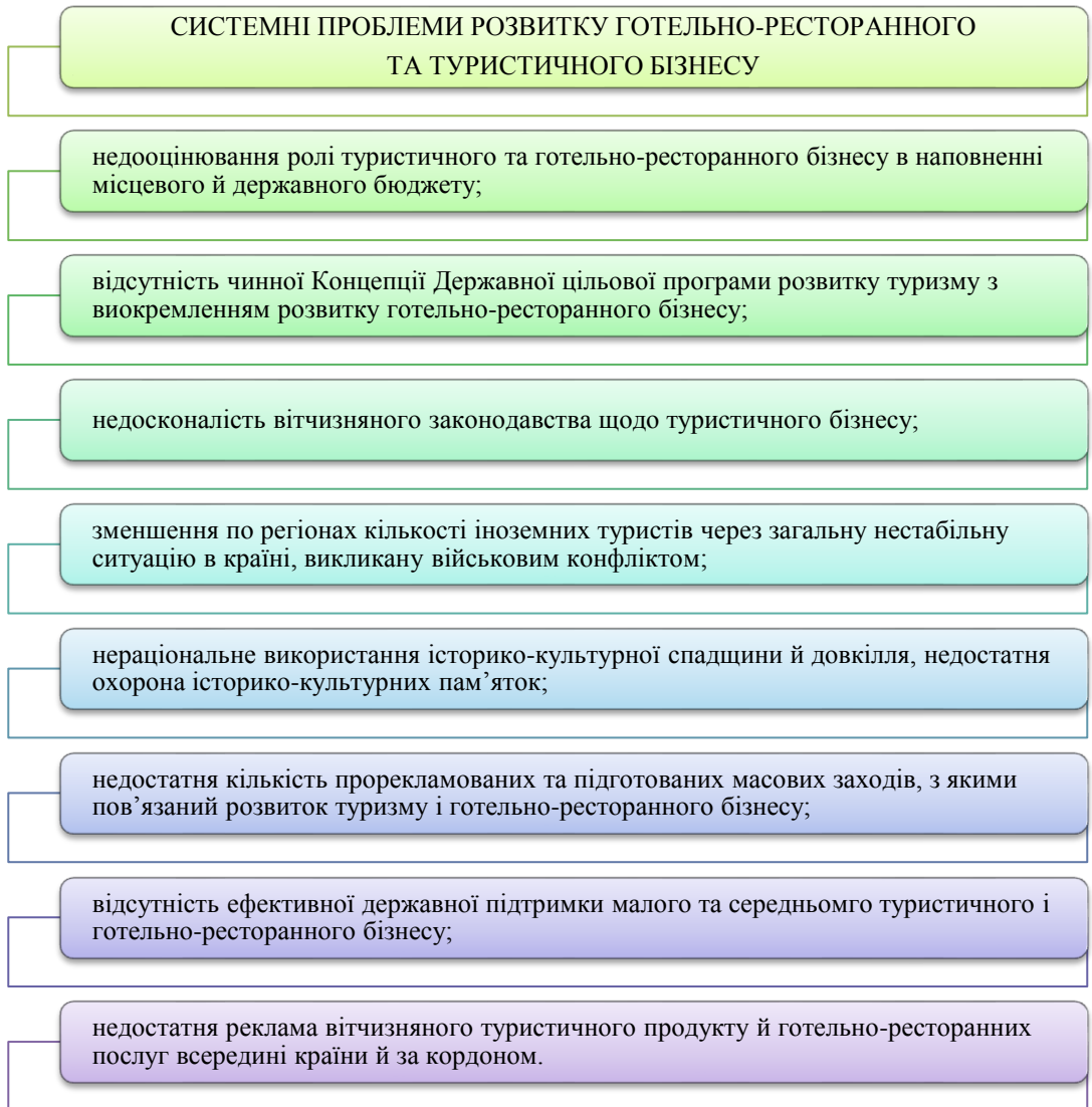
Рис. 1. Системні проблеми розвитку готельно-ресторанного і туристичного бізнесу

Дослідниця А. Помаза-Пономаренко [6] зазначає, що «через зовнішню агресію проти України збільшилася кількість постраждалих осіб, як військових, так і цивільних. Вони потребують лікування, реабілітації й відновлення їх фізичного та/або психоемоційного стану. Вважаємо, що на сучасному етапі функціонування України та в перспективі розвиток лікувально-оздоровчого туризму набуватиме все більшої актуальності. Лікувально-оздоровчий туризм може бути спрямований на внутрішніх туристів й іноземців. Водночас, реалії України наразі такі, що її туристичний потенціал може забезпечити, насамперед, задоволення рекреаційних потреб власних громадян, але не іноземних». При цьому «довгі роки в Україні не наважувалися модернізувати рекреаційну інфраструктуру (зокрема, лікувально-оздоровчого спрямування) відповідно до вимог міжнародних стандартів. Однак