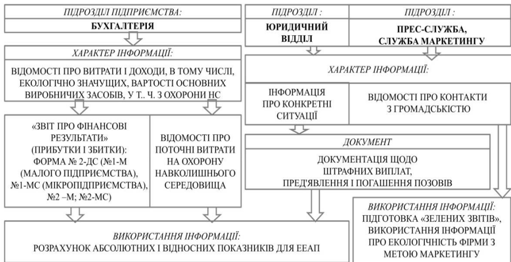
Рис. 4. Інформаційні джерела для розрахунків: форми фінансової звітності та додаткова інформація про конкретні ситуації Джерело: розроблено авторами

Необхідно зауважити, що окрім форм звітності, зазначених на рис. 4, потрібну інформацію, що безпосередньо стосуються і екологічної складової фінансових звітів, також зазначено в таких документах: «Баланс», форма № 1 (квартальна); «Звіт про фінансові результати», форма № 2 (квартальна); «Звіт про використання та запаси палива», форма № 4-мп (місячна); «Звіт про обсяги реалізованих послуг», форма № 1-послуги (квартальна); «Звіт про капітальні інвестиції», форма № 2-інвестиції (квартальна), а також: «Обстеження ділової активності промислового підприємства», «Обстеження ділової активності промислового підприємства (інвестиції)» тощо [13]. Отже, під час ретельного обстеження діяльності суб'єкта господарювання необхідно зустрітися з топ-менеджерами підприємства, керівниками підрозділів, здійснити огляд промислових приміщень, звертаючи увагу на стан обладнання, умови зберігання сировинних запасів та дуже ретельно вивчити звітність підприємства.