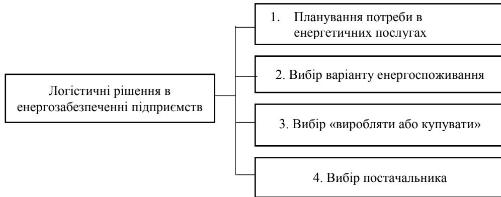
Рис. 1. Основні логістичні рішення в енергозабезпеченні підприємств