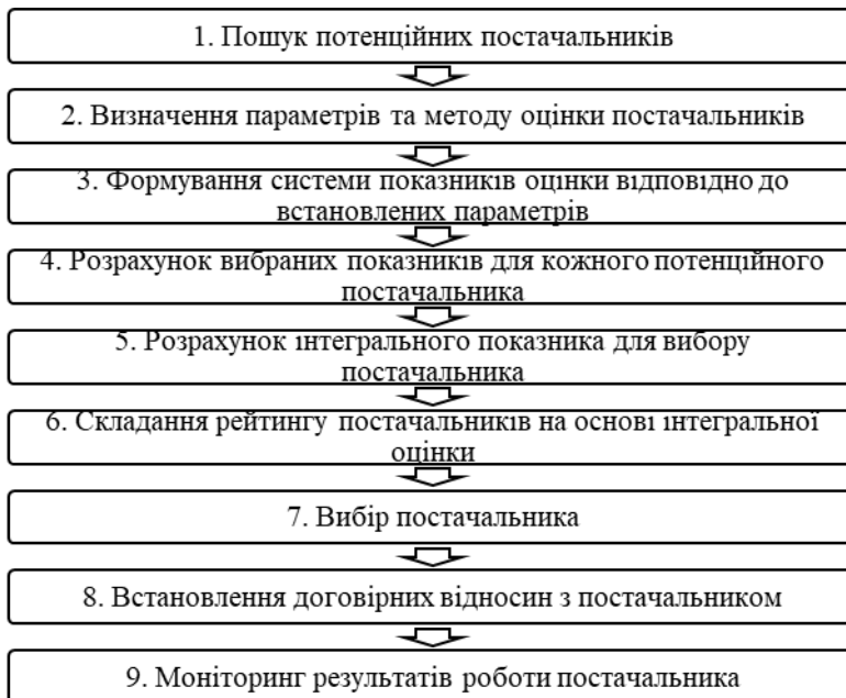
Рис. 4. Основні етапи вибору постачальника

Весь процес вибору постачальника можна представити за допомогою схеми (рис. 4).