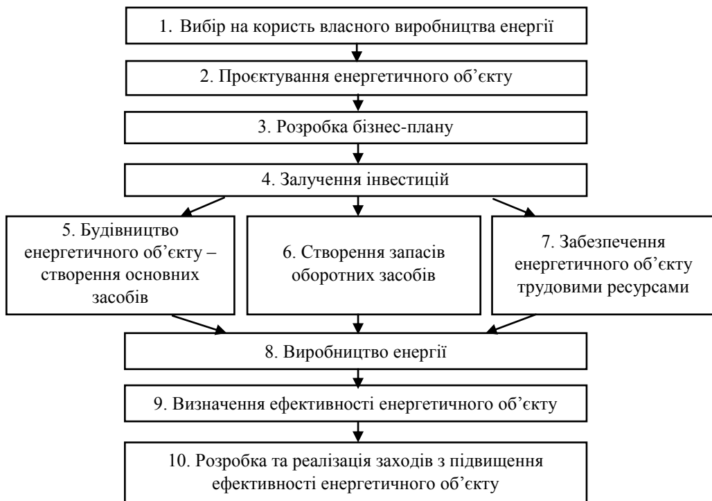
Рис. 3. Етапи створення власного виробництва енергетичних послуг

У кожній конкретній організації різним факторам у роботі постачальників буде надаватися різний пріоритет залежно від конкретних цілей.